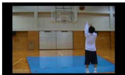
シュートシーン (バスケ篇)