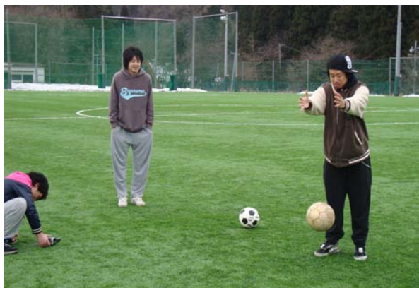
ボールが飛び出てくるシーン