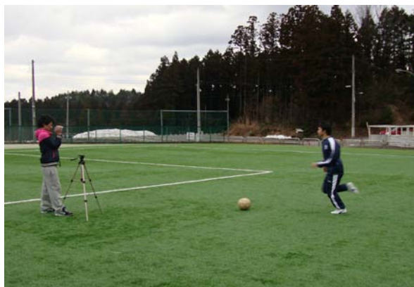
ゴールにシュートするシーン (サッカー篇)