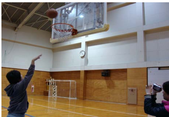
ボールがゴールを通過するシーン (バスケ篇)