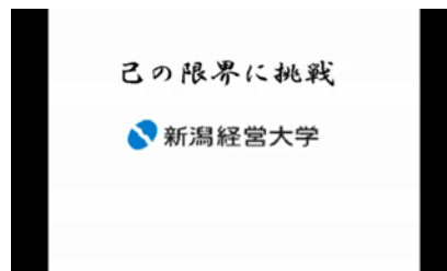
キャッチコピー&ロゴマーク