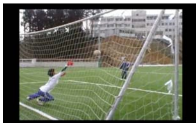
シュートシーン (サッカー篇)